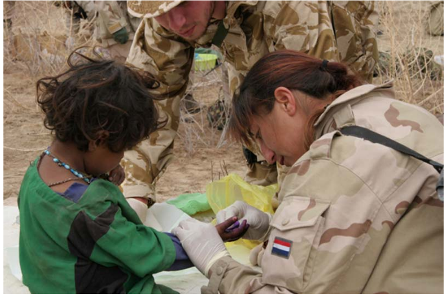
Nederlandse soldate helpt een Afghaans kind

3) Doel van het fotoboek is culturele verschillen duidelijk te maken. Wellicht kunnen leerlingen op internet ook foto's van Afghaanse baby's vinden zodat er vergeleken kan worden?