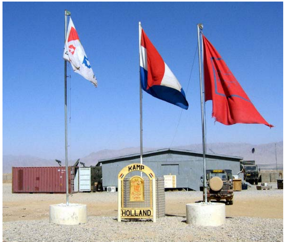
Kamp Holland in Tarin Kowt

Vrouwen werden onder de regering van de Taliban wreed onderdrukt. Maar vrouwenorganisaties zijn teleurgesteld over de vooruitgang die er sindsdien geboekt is. Er is tegelijkertijd veel discussie over de rol van buitenlandse hulporganisaties in Afghanistan. Dit geldt zowel voor hun prioriteiten als hun werkwijzen. Ook de verhouding tot de aanwezige buitenlandse troepen - ook door de ontwikkelingsorganisaties in Afghanistan zelf, ook voor buitenlandse partners als Oxfam Novib - is een punt van discussie.