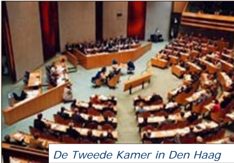
De Tweede Kamer in Den Haag

Je bent op een saai verjaardagsfeestje. Op een of andere manier komt het gesprek op verkiezingen voor de Tweede Kamer. Politiek interesseert je eigenlijk niet zo, maar enkele uitspraken over 'die lui in Den Haag' vind je wel grappig.