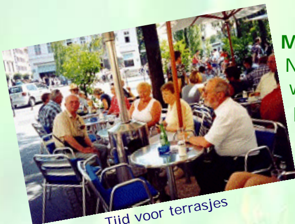
Tijd voor terrasjes

Niet alleen worden de dagen langer, het wordt ook warmer. Mensen gaan weer op pad, maken natuurwandelingen. Soms is het al warm genoeg voor een terrasje. Een belangrijk lentefeest is Pasen.