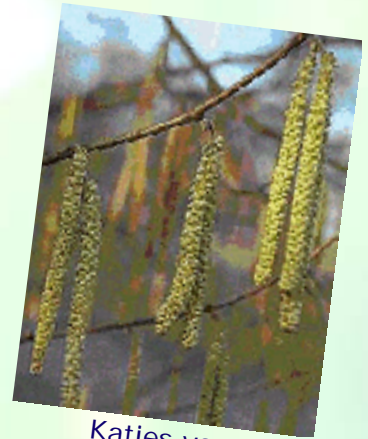
Katjes van de hazelaar

Op 21 juni is de lente afgelopen en begint de zomer.