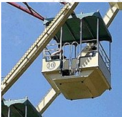
Wie wil er wonen op Reuzenrad 10?